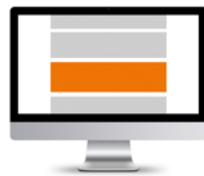
Wideboard * 994 x 250