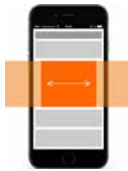
Mobile Panorama Ad 700 (300) x 250