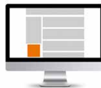
Promobox 210 x 210