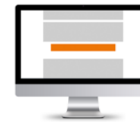
Leaderboard * 728 x 90