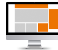
Rising Stars Ad-Package 994 x 250, 300 x 600, 300 x 250