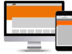
Search Background 2465 x 400