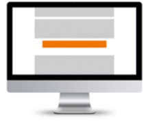
Leaderboard * 728 x 90