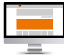
Search Board 988 x 280