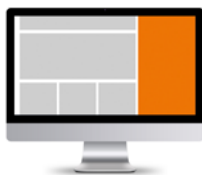
Sitebar 1500 x 2000 (responsive)